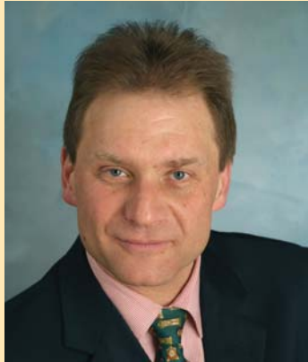
Grußwort des Oberbürgermeisters der Stadt Solingen Norbert Feith, anlässlich einer Benefizveranstaltung im November 2010.